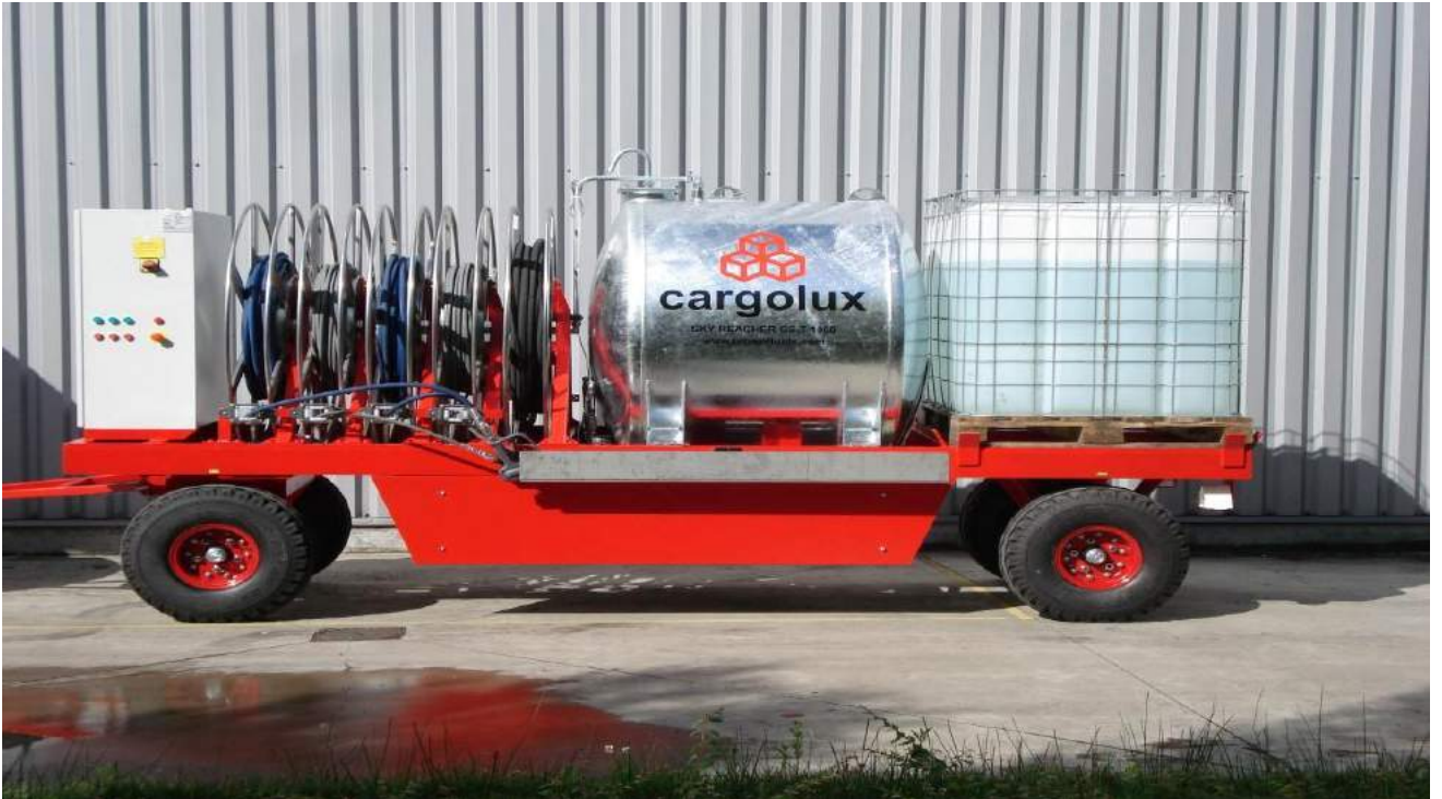
ETS - SKYREACHER TYP GS T 1000 orijinal resim CARGOLUX